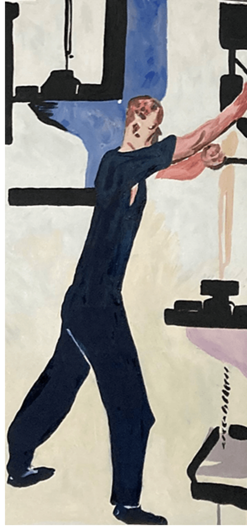
JPM 2021 j