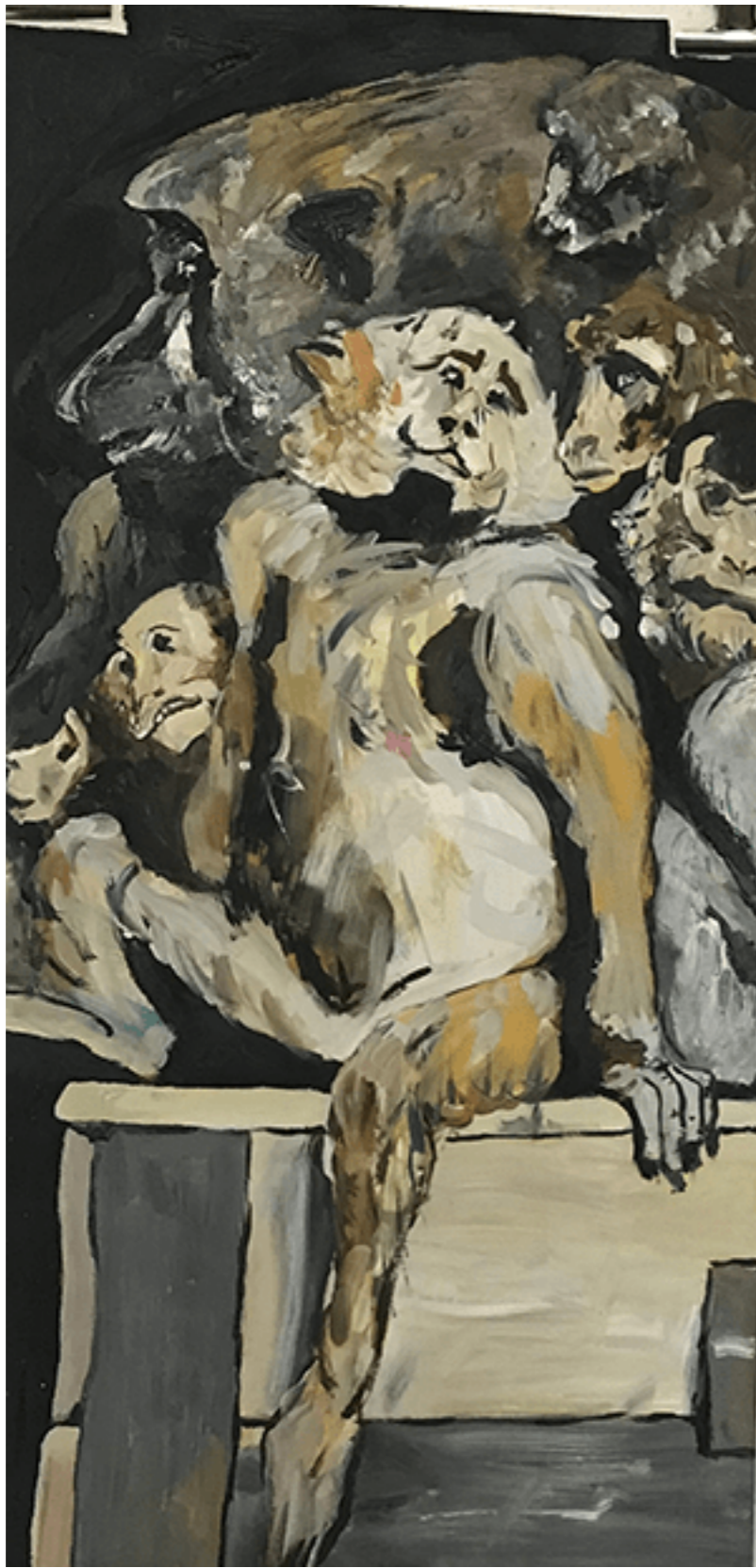
JPM Bestiarium 9